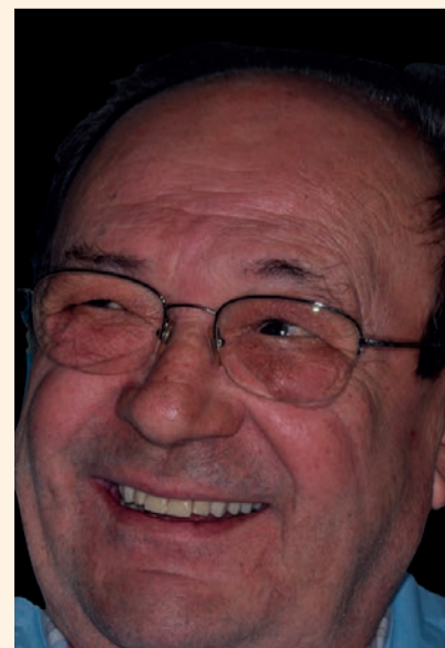
Figg. 13-18 - Protesi ultimata e consegna al paziente.