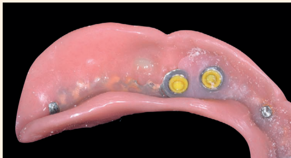
Figg. 11-12 - Resinatura definitiva delle cappette.